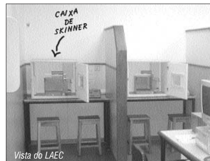
Vista do LAEC

O Brasil é assustadoramente diverso em sua fauna, e essa diversidade está assustadoramente ameaçada. Tranqüiliza então saber que há aí um batalhão de jovens interessados em conhecer melhor a conduta de nossos bichos. Nos dias 14 a 17 de novembro, o campus da UNESP, em São José do Rio Preto, testemunhou o XXV Encontro Anual de Etologia , com um volume recorde de estudantes inscritos, cobras da área e bons trabalhos apresentados. O jubileu de prata dessa reunião de gente naturalmente curiosa teve, como tema, o “comportamento social”, em homenagem ao pioneiro Walter Hugo de Andrade Cunha (presente na abertura, inclusive). O estudo das relações sociais dos animais parece reunir os trabalhos mais promissores, ao lado da “ecologia comportamental”. Que a nova safra de pesquisadores ajude o humano a ser, cada vez menos, lobo do lobo. (BV)