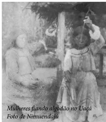
Mulheres fiando algodão no Uaçá