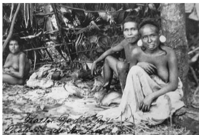
Botocudos, 1909